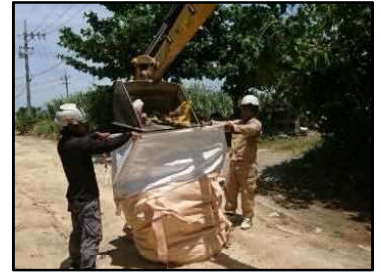
不法投棄物集積状況