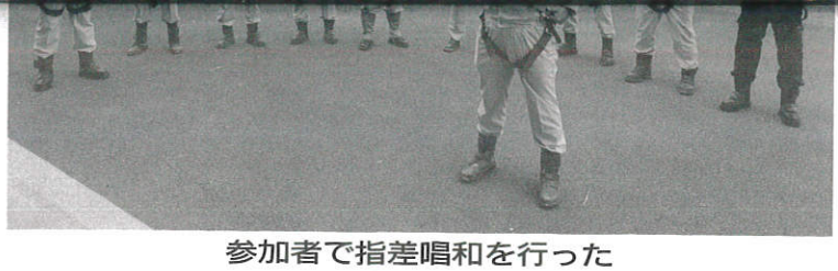
参加者で指差唱和を行った

担い手の確保・育成 受注機会確保 労働環境の改善 技術力の維持・向上 建設産業の魅力発信 ICT技術の活用 お問い合わせ 〒901-0152 沖縄県那覇市宇小塚 1831-1 314号室 ☎: 050-3628-8590 FAX: 098-917-0022 [担当: 比嘉、赤嶺] HP http://www.oki-shindan.or.jp E-mail jsmeca47@oki-shindan.or.jp 一般社団法人 沖縄県中小企業診断士協会